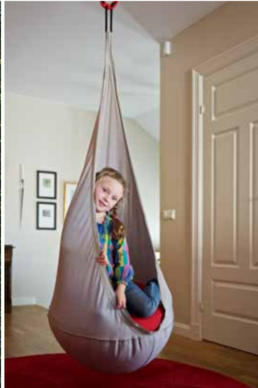
OVAN Wilda i den takhängda gungan från Ikea.